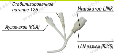
Рис. 1 Схема подключения видеокамеры