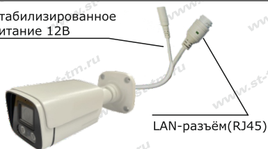
Рис. 1 Схема подключения видеокмеры