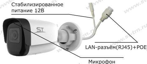
Рис.1 Схема подключения видеокмеры