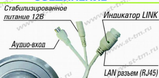
Рис. 1 Схема подключения