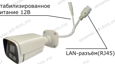
Рис. 1 Схема подключения видекамеры