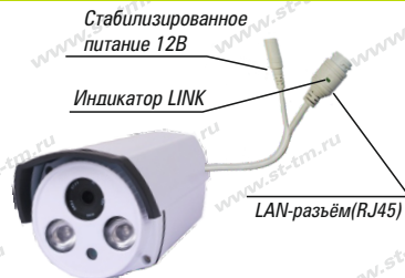
Рис. 1 Схема подключения