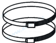
Рис.2 Монтажные кольца