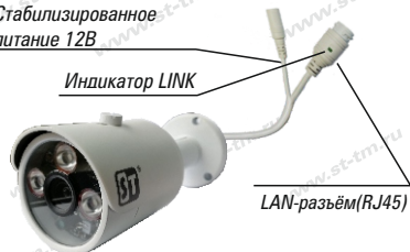
Рис. 1 Схема подключения видеокмеры