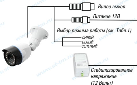
Рис.1 Схема подключения