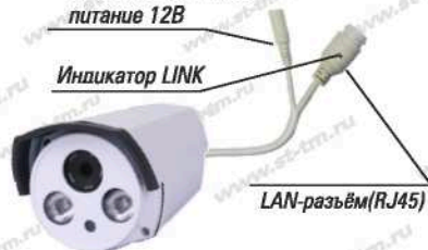
Рис. 1 Схема подключения