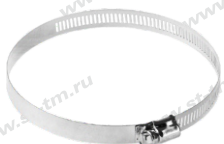
Рис.2 Монтажные кольца