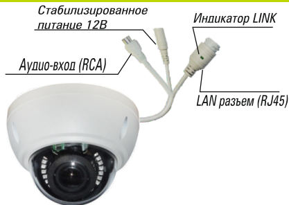
Рис.1 Схема подключения