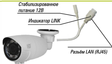
Рис. 1 Схема подключения видекамеры