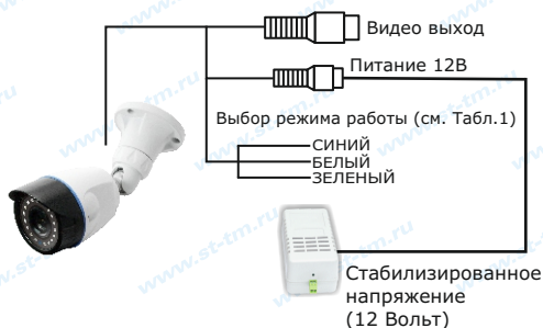
Рис.1 Схема подключения