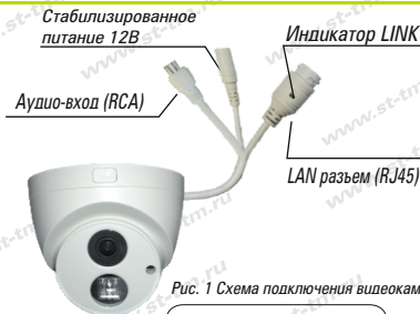
Рис. 1 Схема подключения видеокамеры