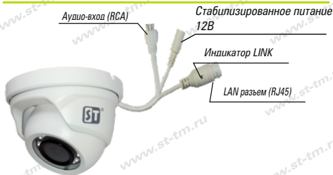
Рис. 1 Схема подключения видеокамеры